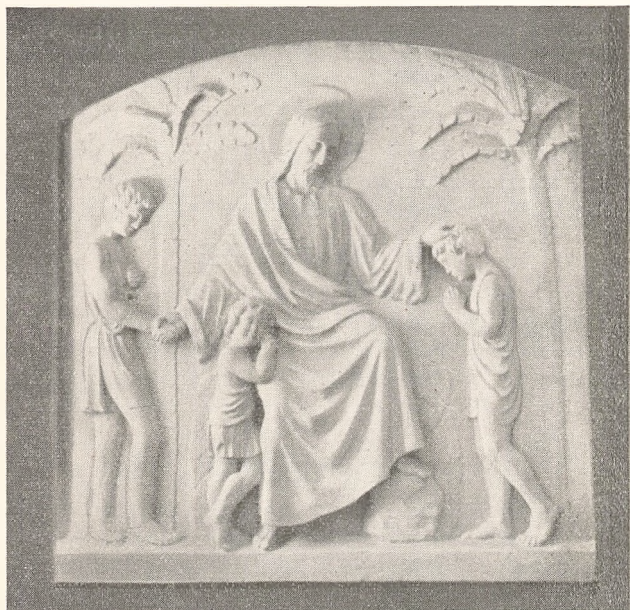
Optaget med Leica-Objektiv F/3,5 ; 35 mm.