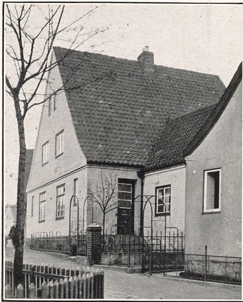
Børnehaven i Adelbykamp.