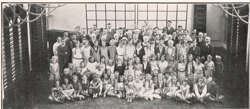
Fra Mødet med Tillidsmændene i Landdistrikterne. 27. Juni 1931.