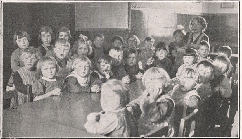
Børneflokket i Adelbykamp