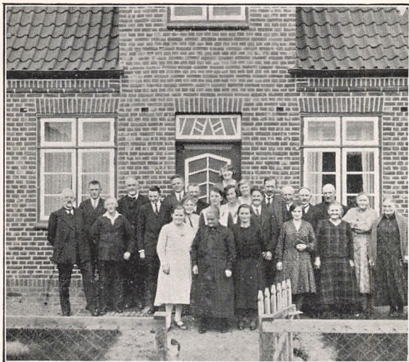
Forsamlingshuset i Ladelund. 4. Oktober 1931.