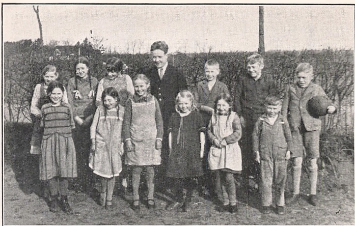
Elever og Lærer i Langbjerg. Marts 1932.