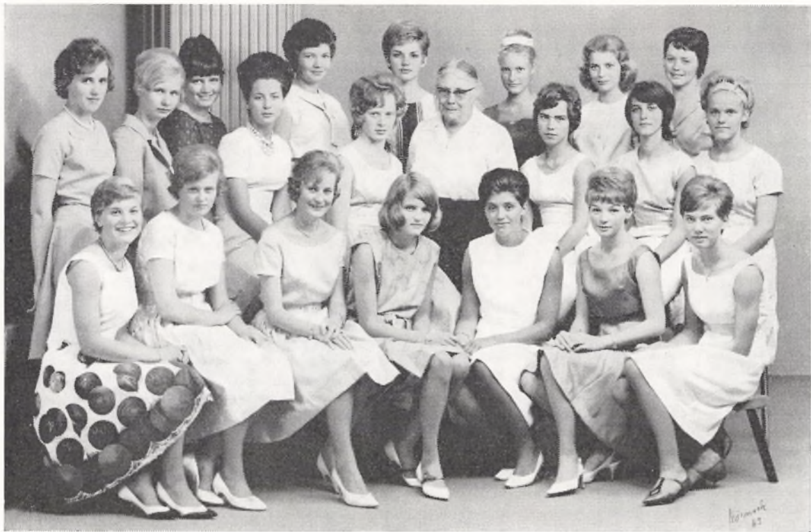
Realklasse a 1963