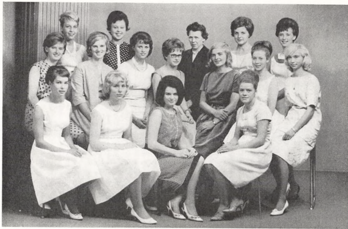
Realklasse c 1963