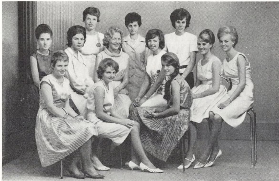
Realklasse b 1963