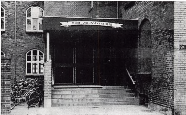
Den nye hovedindgang.