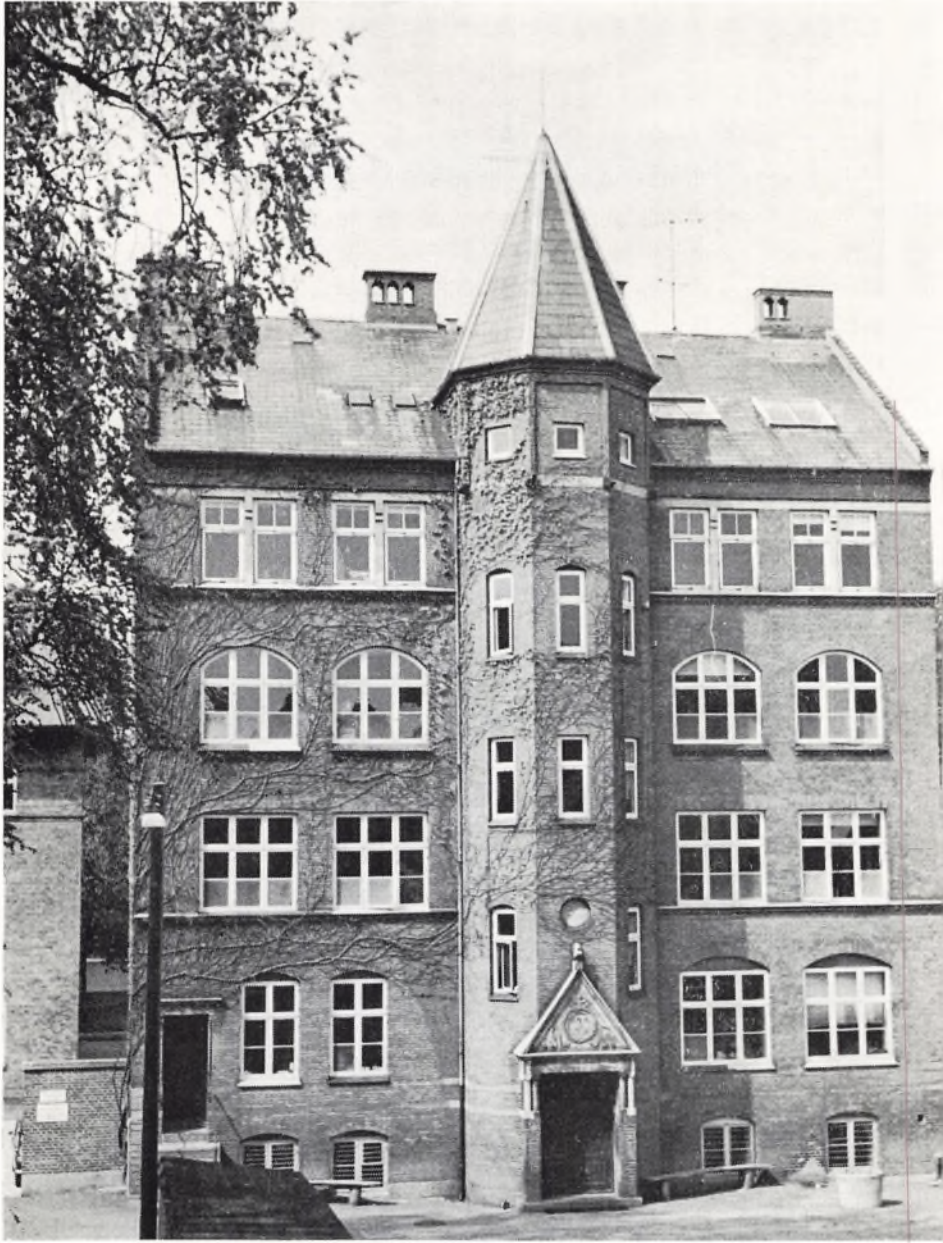
KURSUSBYGNINGEN (Den tidligere drengeskole)