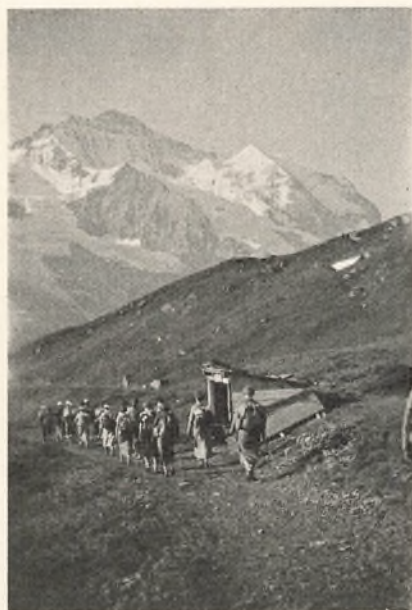
Paa Fodtur i Berner Oberland.