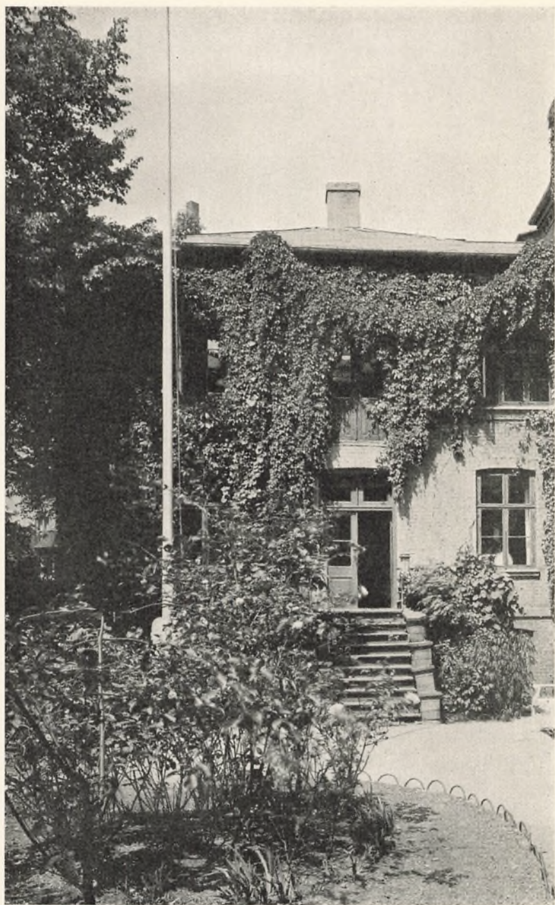
En svunden Idyl.