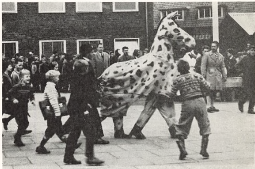
Polsegildet i skolegården i anledning af Handelsstandsforeningens 75 års jubilæum.