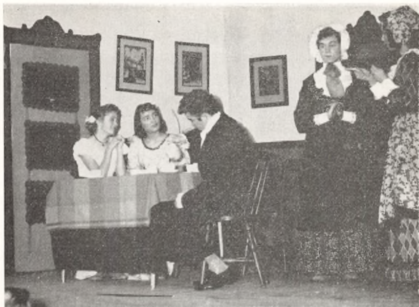
Fra skolefesten. Scenebillede fra »Aprilsnarrene«.