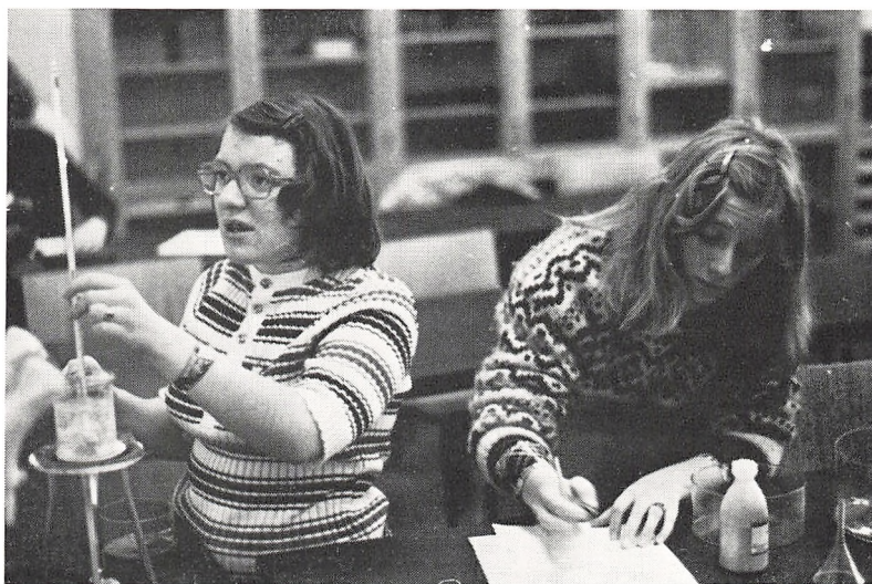
Fysiktime i 1. x.