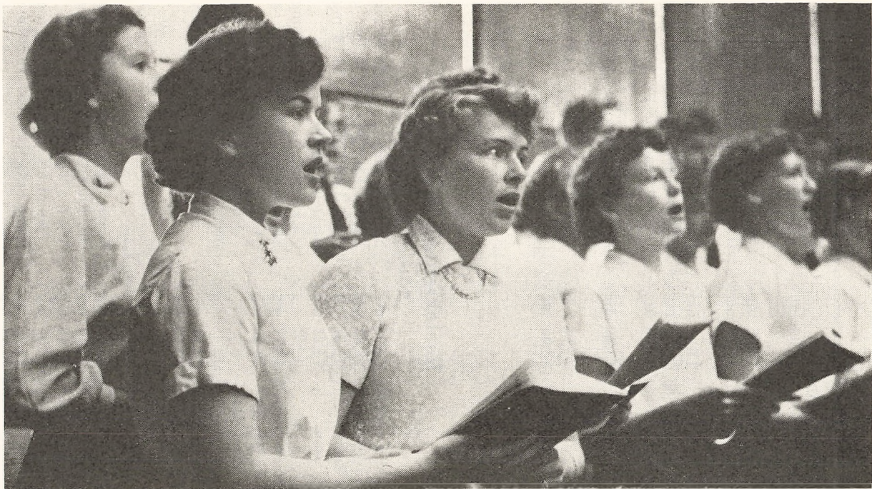
Fra skolens 100-års fødselsdag.