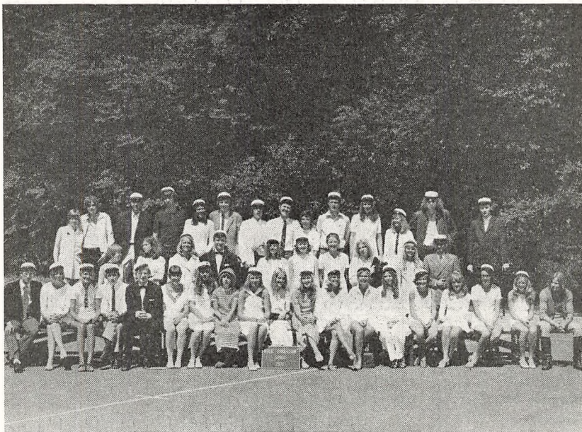
De sproglige studenter 1970.