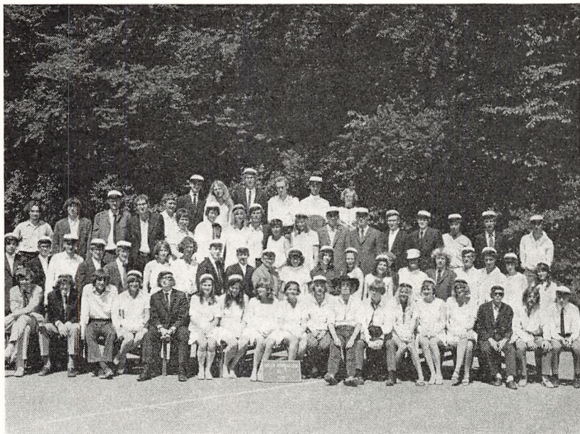
De matematiske studenter 1970.