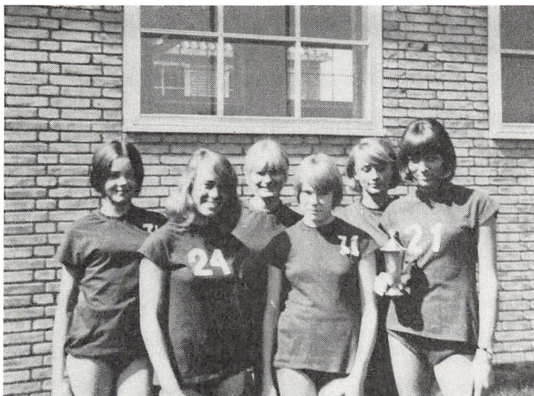
Vinderhold fra landsbasketball-turnering.