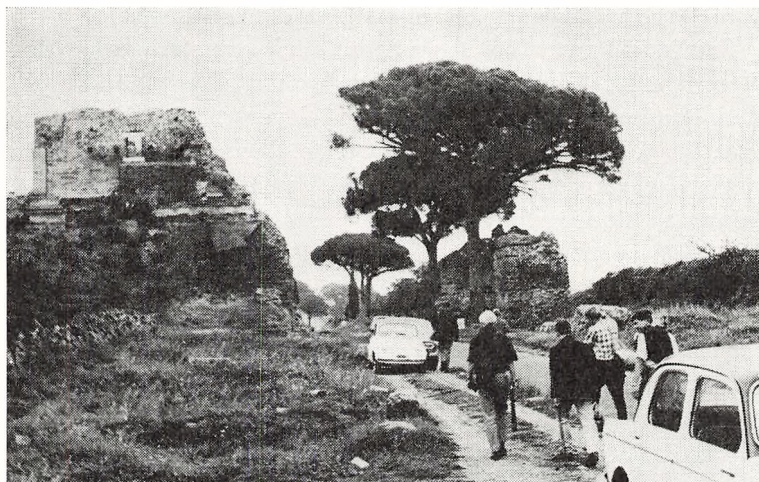
II D's tur til Rom, Via Appia Antica.