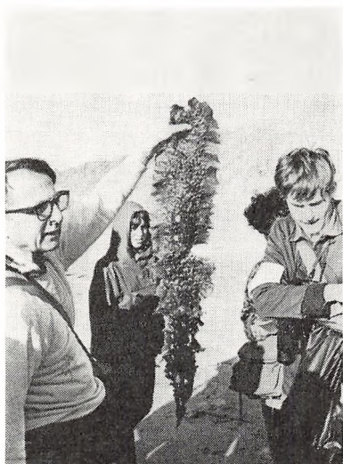
Ilo p på biologisk lejrskoleophold på Læsø. Tur langs stranden.