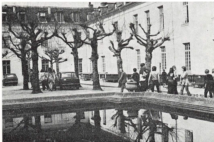
2a på Centre International d'Etudes Pédagogiques, Sèvres.

24.—26. februar: Skolekomedie. — Elever fra 2g opførte