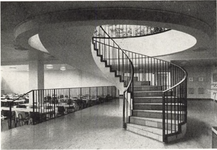
Nedgang til frokoststuen

betrages som noget yderst glædeligt, ja, som intet mindre end en livsbetingelse for et foretagende af denne art. Debattens hovedlinier vil fremgå af Scriptus, nr. 64.3 og 65.1.