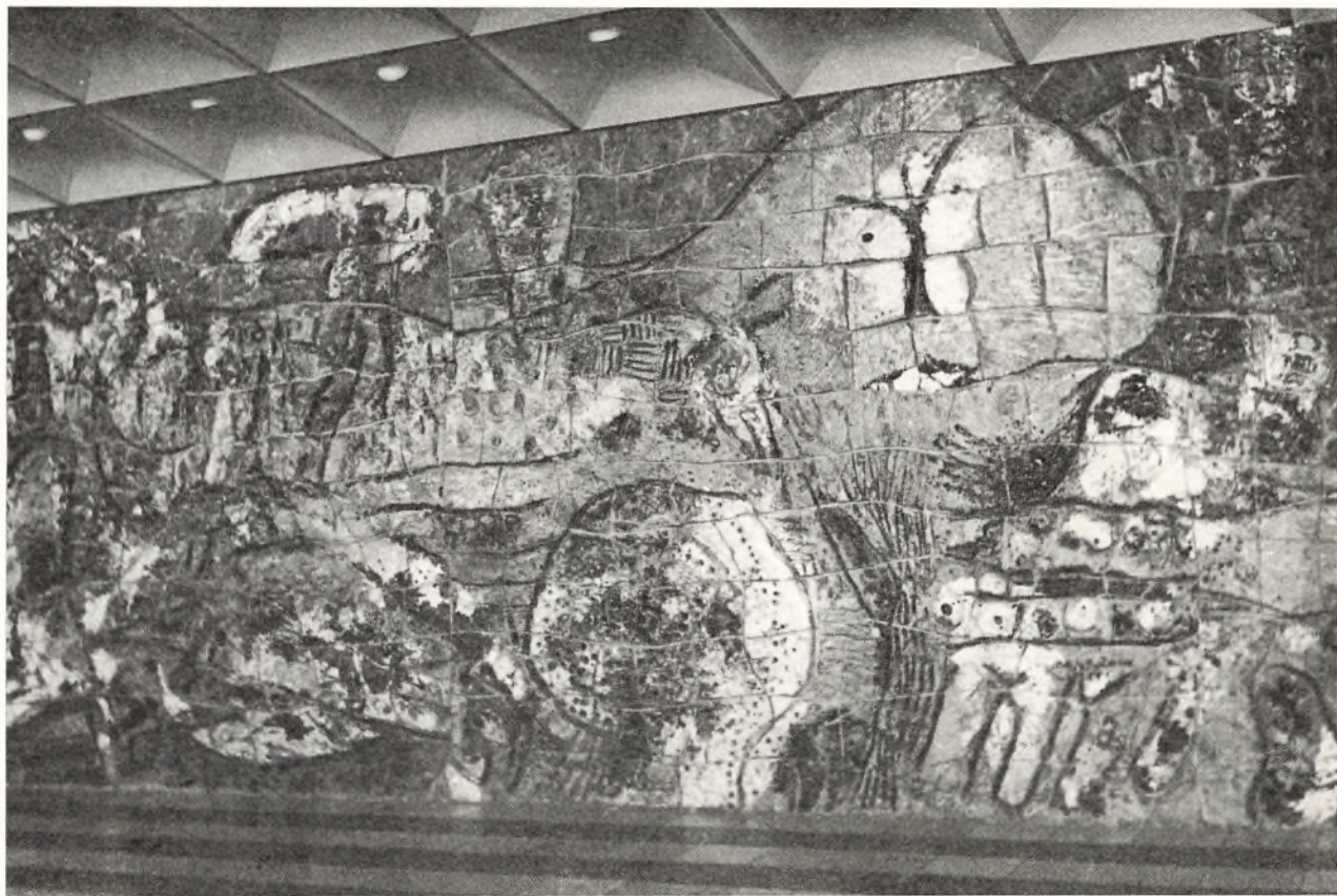
Udsnit af Asger Jorns relief i forhallen.