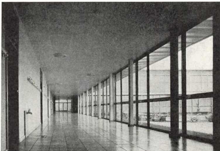
Korridor i sydflojen