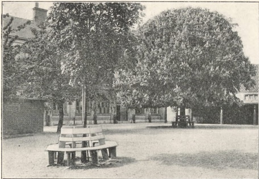
Skolegården ved Foraarstil.