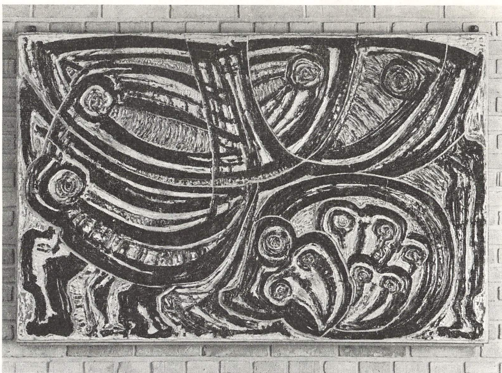
Keramisk relief af Birte Weggerby. Gave til Hjørring Gymnasium fra kunstnerinden 1965.