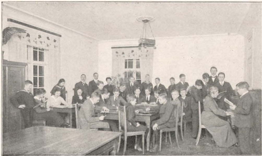
Den store Elev-Dagligstue.