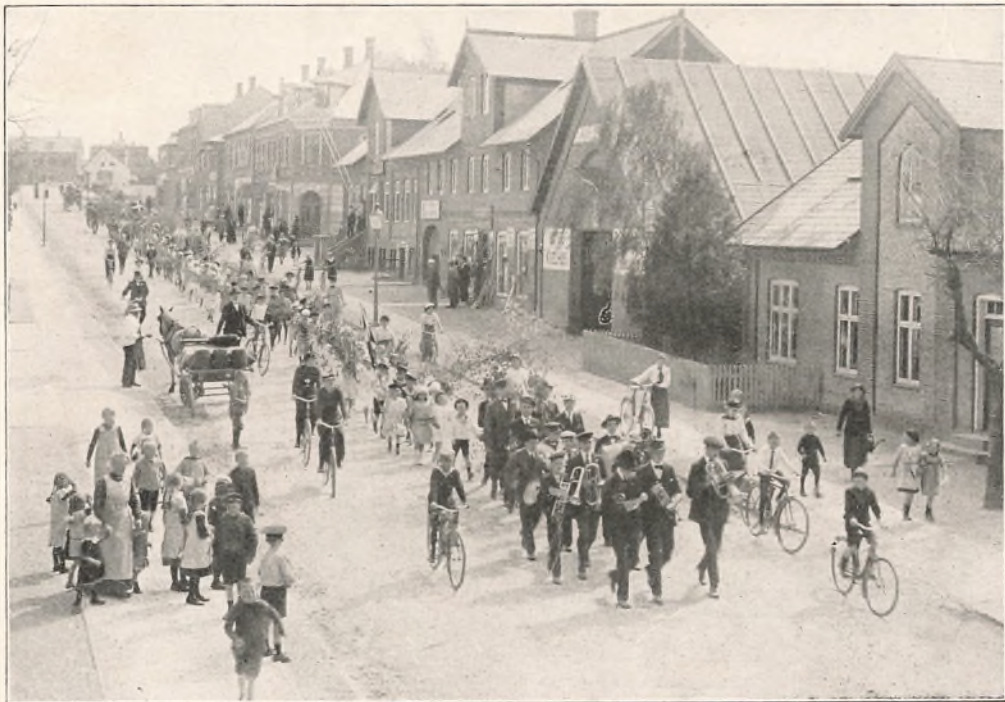
Optoget gennem Byen ved Majfesten.