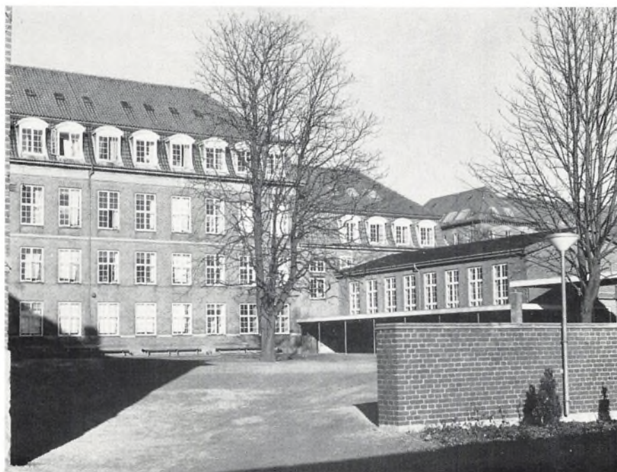
Den gamle hovedbygning set fra hjørnet af den nye fysik- og kemifløj