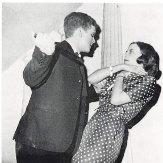
— til et ægte Soya'ske gys