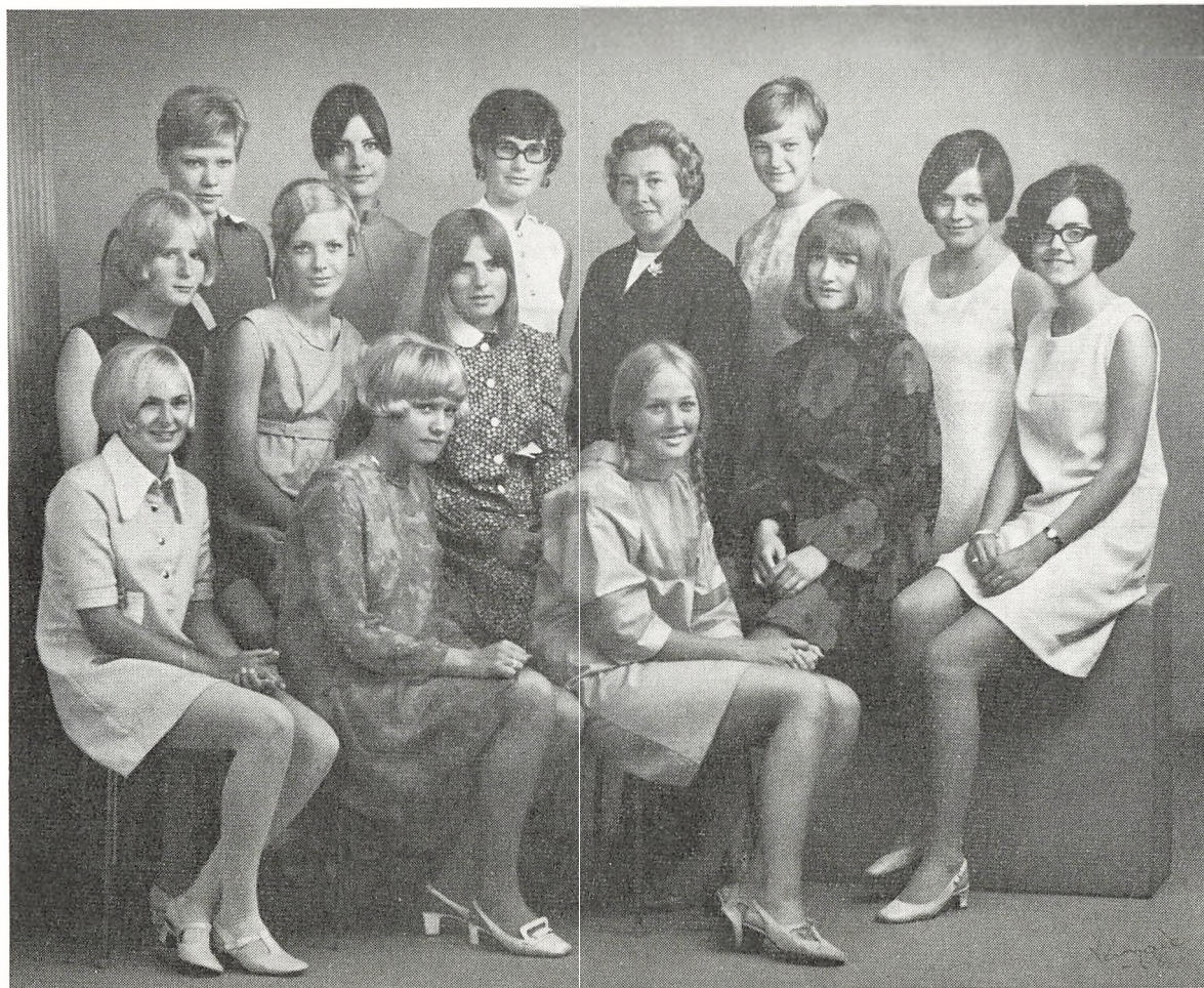
Realklasse A 1968