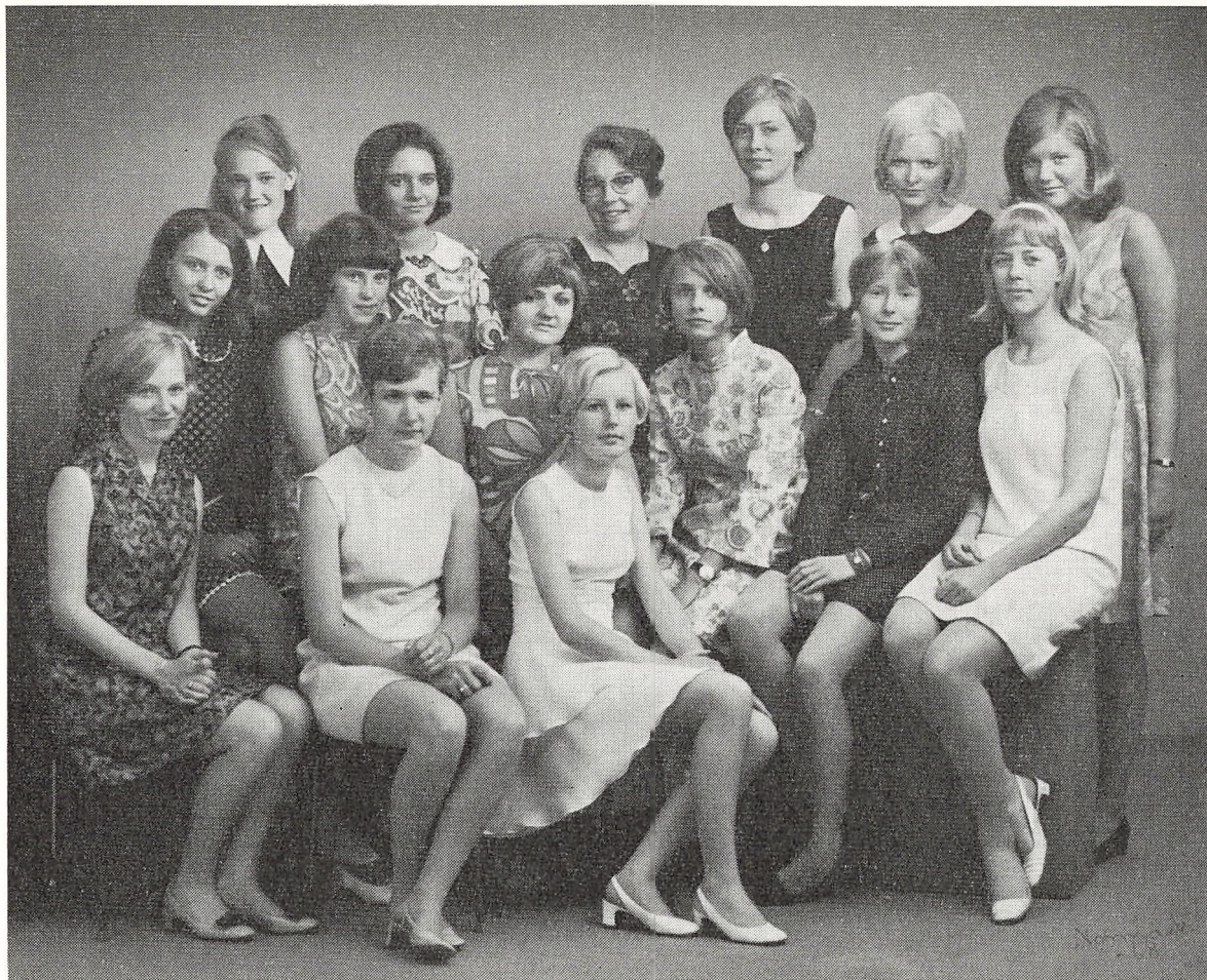
Realklasse B 1968