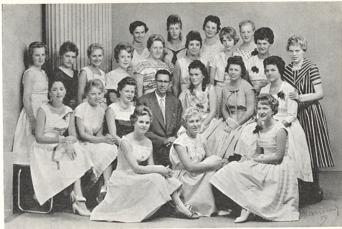
Realklasse a 1959