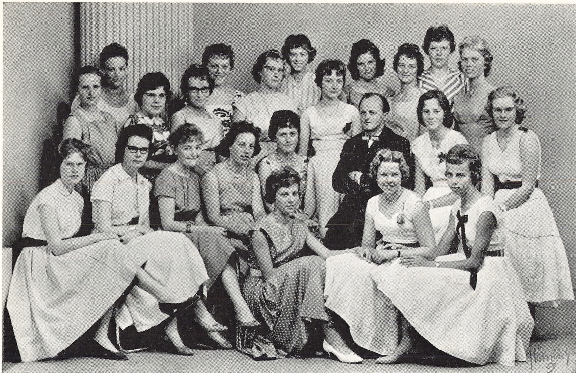
Realklasse b 1959