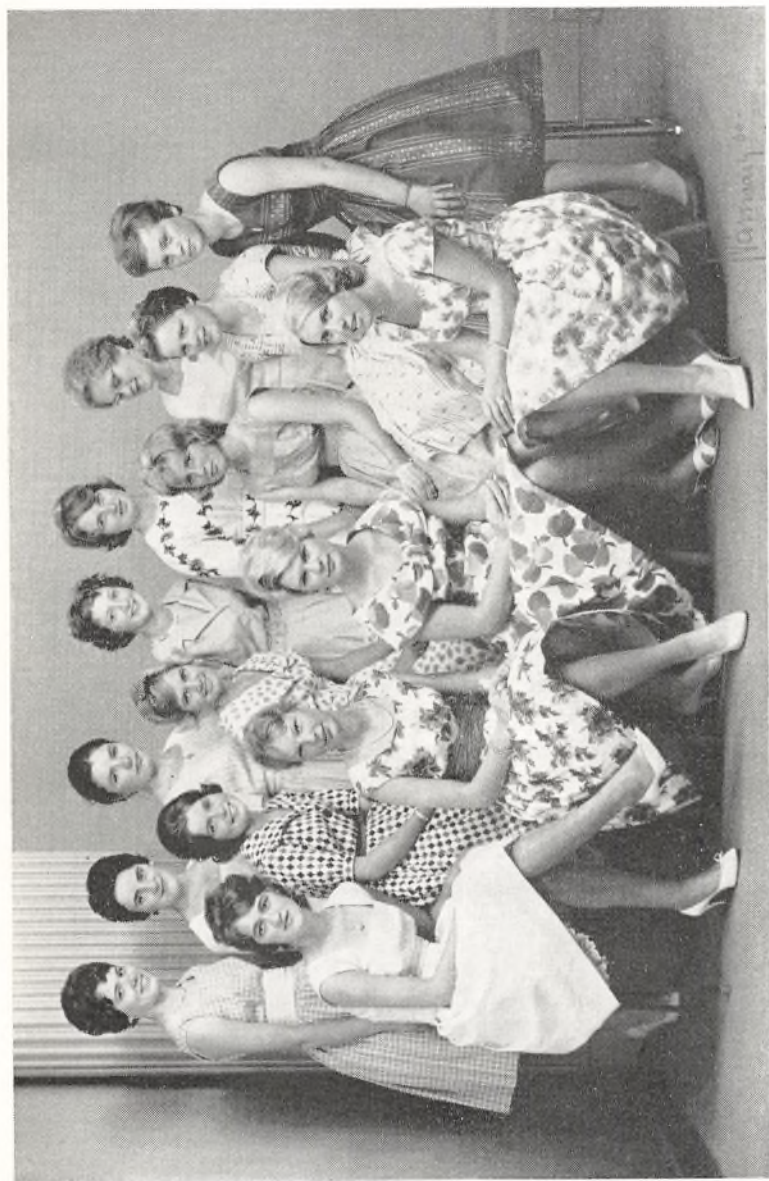
Realklasse b 1960