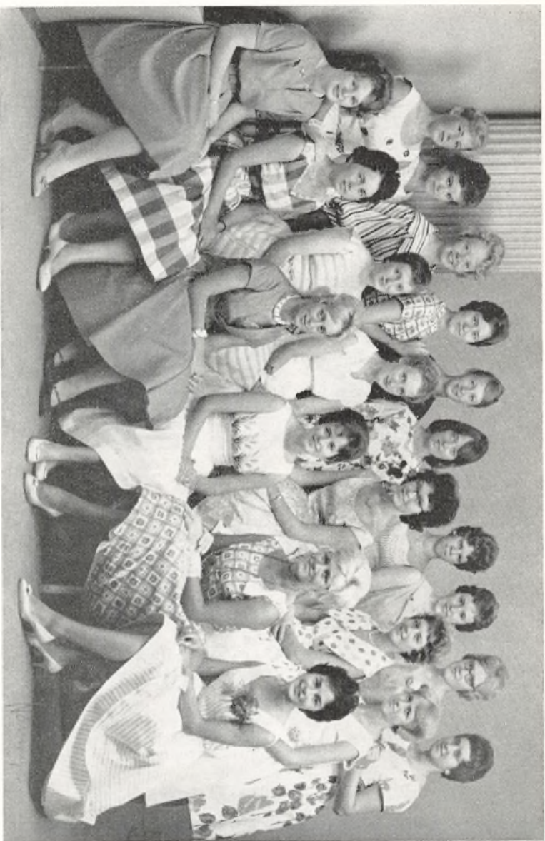
Real Klasse a 1960