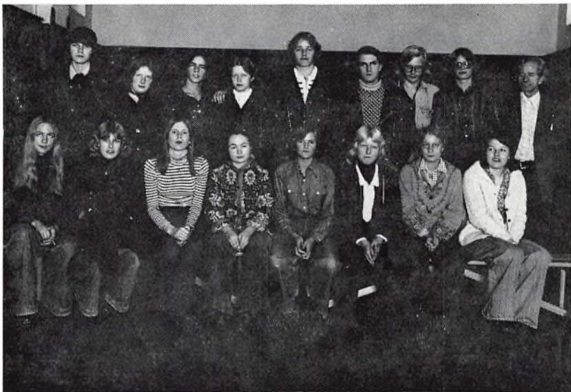
3. real a