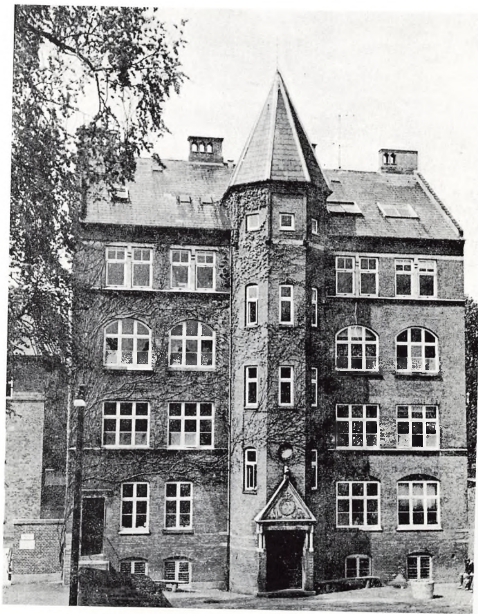
KURSUSBYGNINGEN (den tidligere drengeskole)