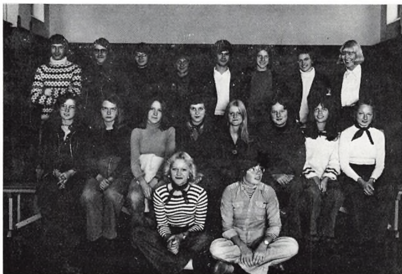
3. real b