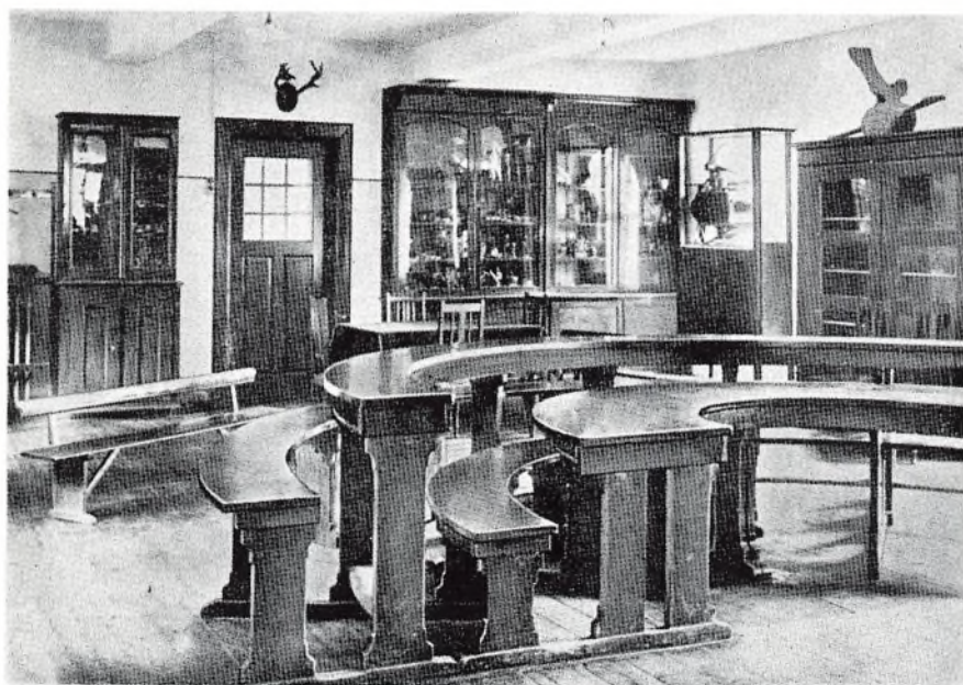
»Den runde bæk« i naturfagslokalet.

Under disse vilkår trivedes både skolen og kursus godt, indtil skoleloven af 1958 blev vedtaget af rigsdagen. Denne lov gav mange mindre kommuner økonomisk mulighed for en ekspansion på skoleområdet. Fra 1960 begyndte omegnskommunerne at bygge nye centralskoler med eksamensafdelinger, hvorfor tilgangen af elever fra landet langsomt blev mindre og mindre. I 1959 begyndte Vestfyns Gymnasium i Glamsbjerg og i 1962 omdannedes realskolen Mulernes Legatskole til et nyt kommunalt gymnasium her i Odense. Den status Odense Studenterkursus havde haft de sidste år som en slags reserve-