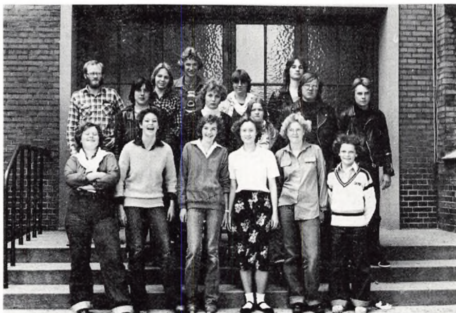
10. kl. b 1979.