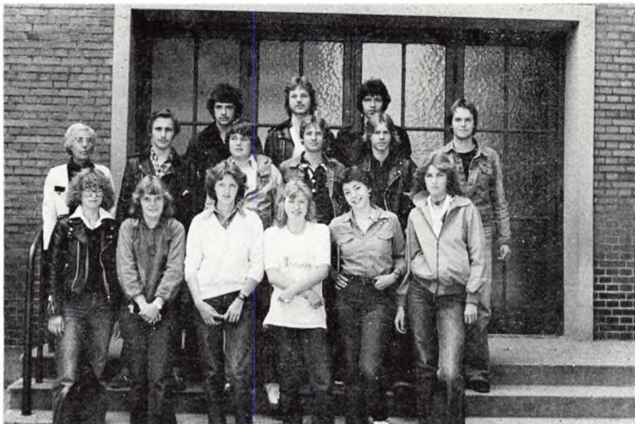
10. kl. a 1979.