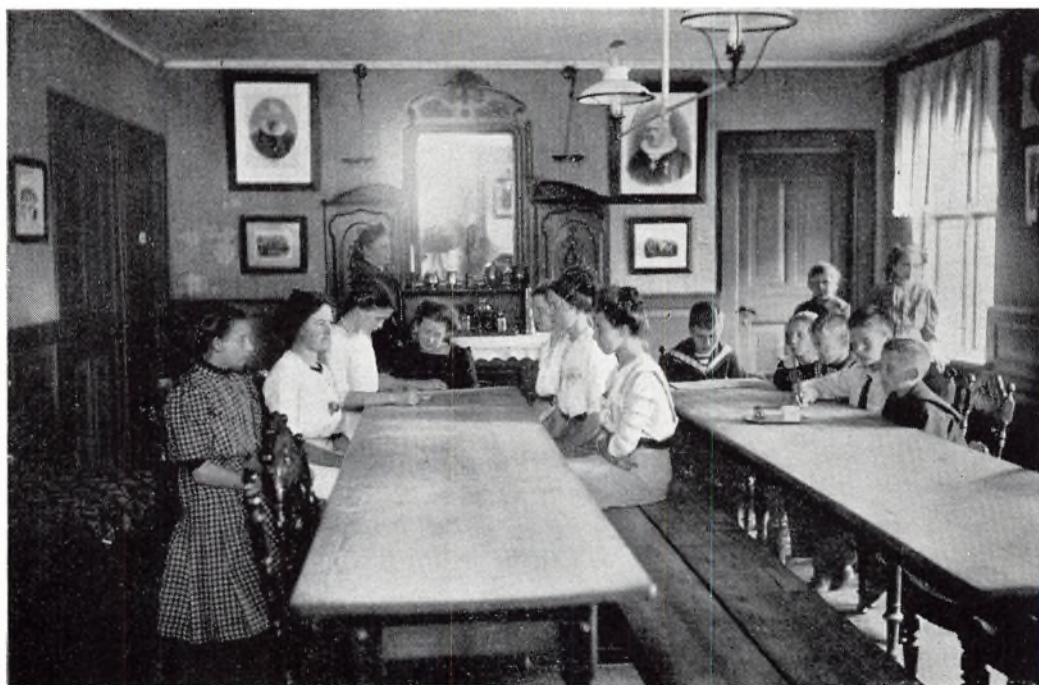
Kostelever i spisestuen 1911.

Men også udadtil skete der noget med institutionen i disse år. Siden 1914 har drengeskolen og pigeskolen ligget her ved Kongens Have som to selvstændige skoler med hver sin leder. I disse år blev man på skolerne klar over, at det ikke mere var relevant med drenge og piger i hver sin skole. Blandt andet derfor blev de to skolars ledelser enige om at begynde samarbejde for at omdanne skolerne til een selvejende institution. Efter mange forhandlinger