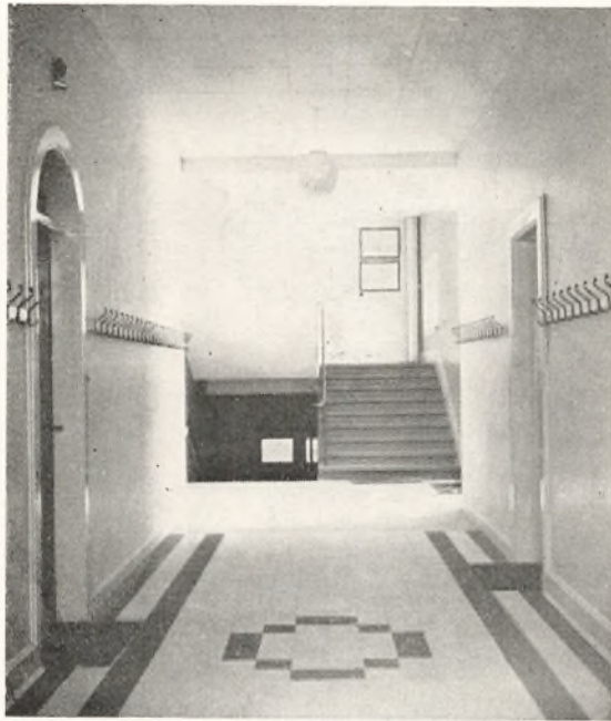
Gangen i stueetagen efter ombygningen

Garn, stof m. m. til håndarbejdsundervisningen betales efterhånden, som det købes.