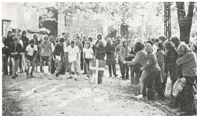
Start til 1500 m terrænløb i Ørstedsparken

Det var sportsstævnets idé, at alle elever skulle deltage, uanset hvilke færdigheder de besad. Derfor var der lavet både A og B hold. Der var følgende aktiviteter at vælge imellem: Fodbold, håndbold, langbold, basketball, volleyball og 1500 m terrænløb (i Ørstedsparken).