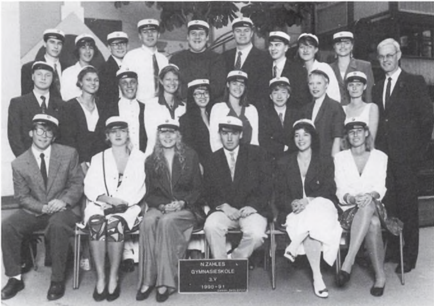
N.ZAHLES GYMNASIESKOLE 3.Y 1990-91