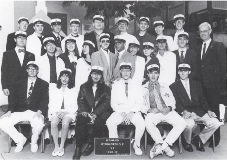
N.ZAHLES GYMNASIESKOLE 3.Z 1990-91