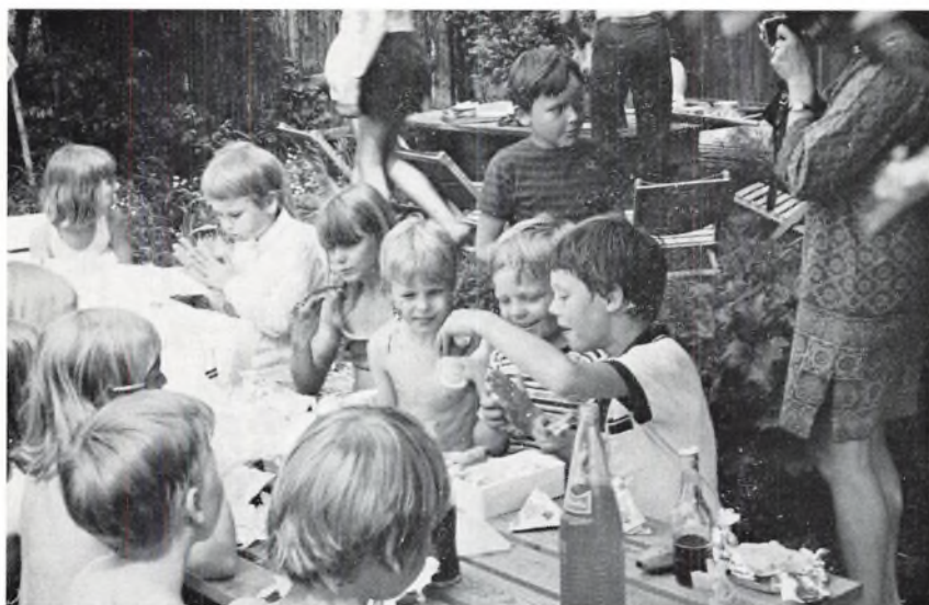
2 h holder frokost i Bennebo (juni 1971).

Klassekvotienten er normalt maksimum 24.