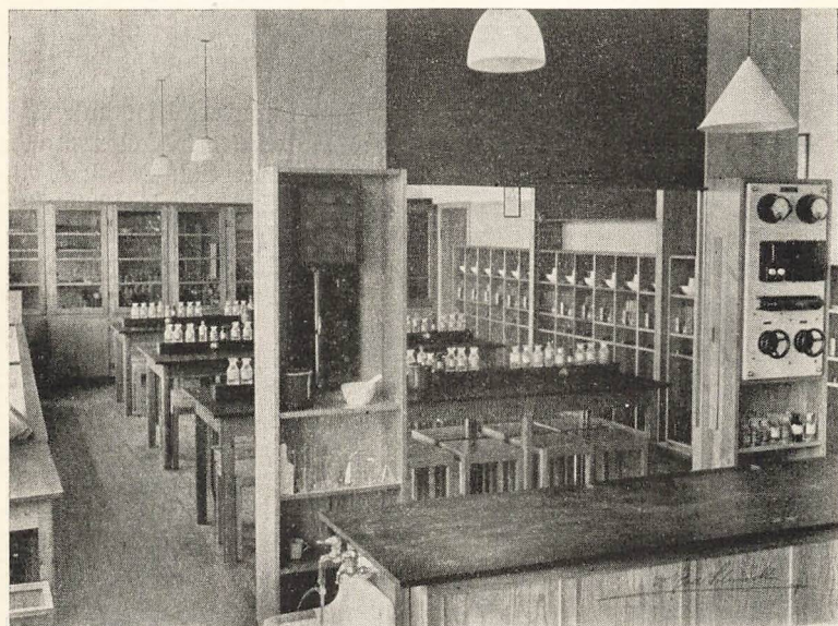
Mellumskolens Fysik- og Kemilokale