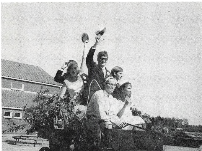
Den sidste — og mindste — studentervogn kører fra skolen (1964)