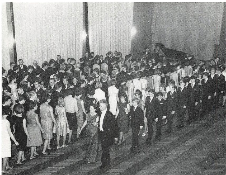
Skoleballet begynder med indmarch, anført af rektor og frue.