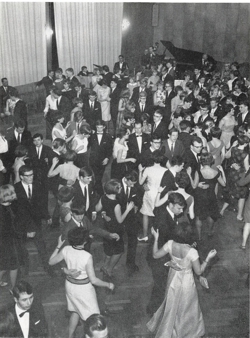
Fra skoleballet 1966.