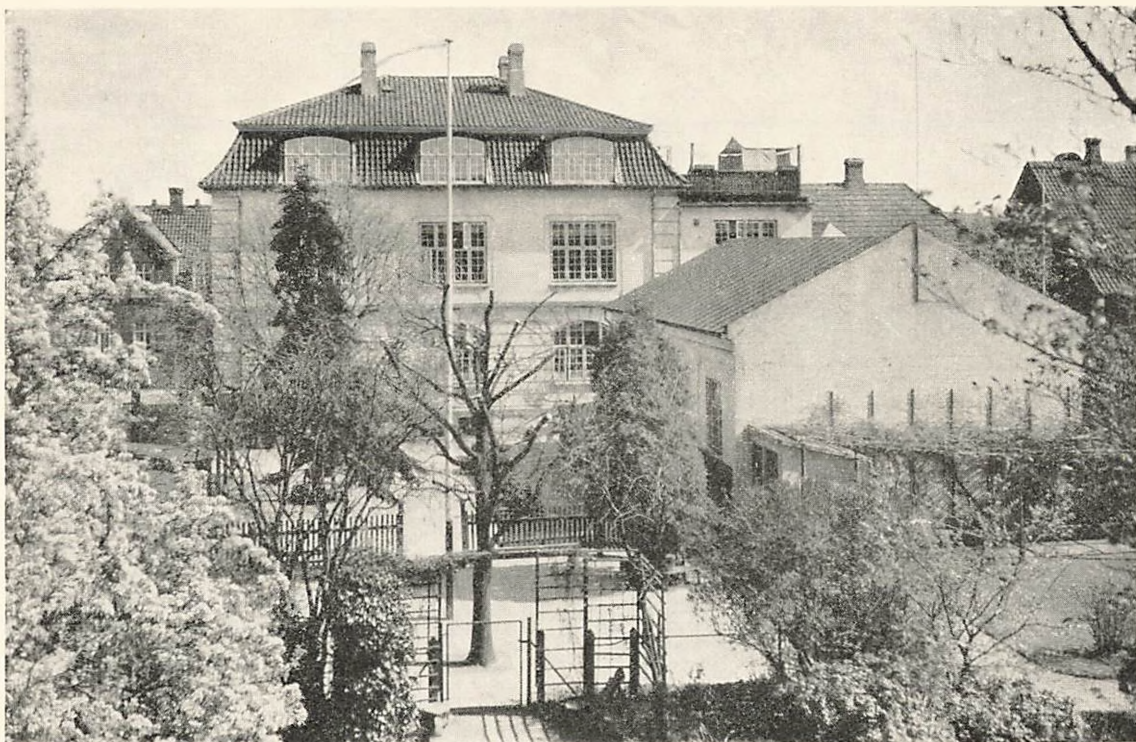
Skolebygningen og de to Legepladser — Underklassernes Legeplads i Forgrunden.