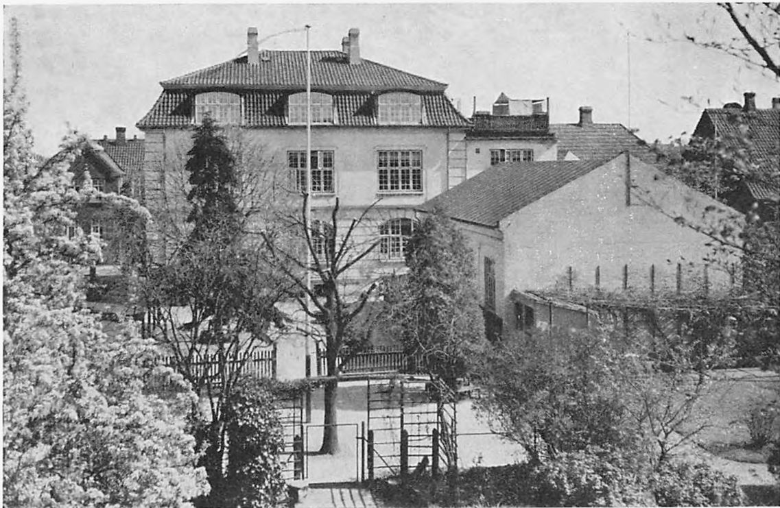
Skolebygningen og de to Legepladser — Underklassernes Legeplads i Forgrunden.