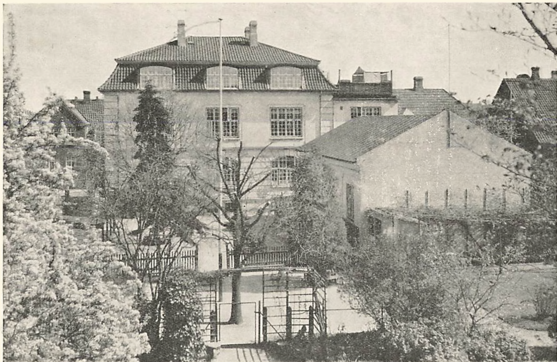
Skolebygningen og de to Legepladser — Underklassernes Legeplads i Forgrunden.