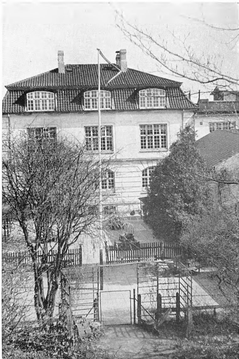
Skolebygningen og de to Legepladser — Underklassernes Legeplads i Forgrunden.