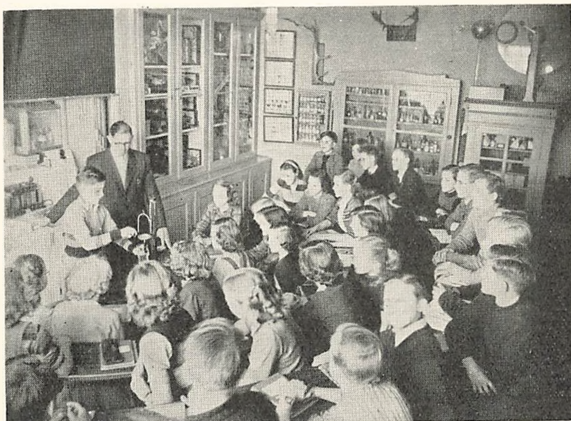
Fra Fysik- og Naturhistorielokalet.