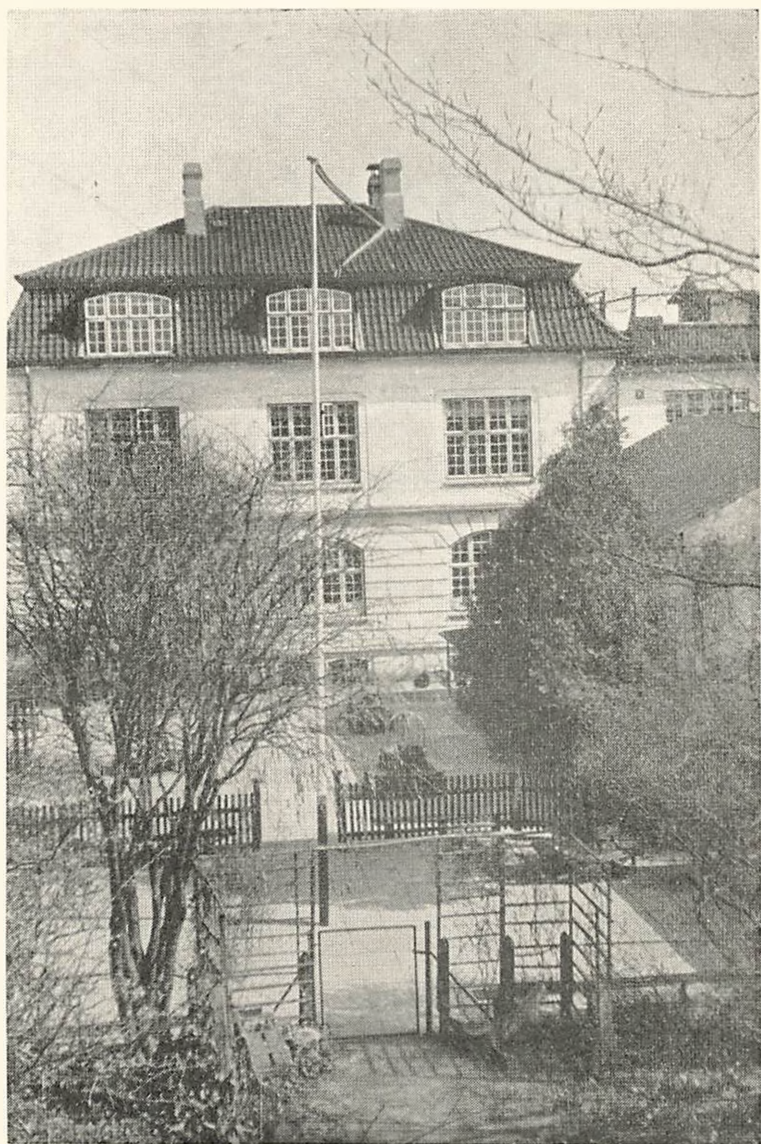
Skolebygningen og de to Legepladser — Underklassernes Legeplads i Forgrunden.