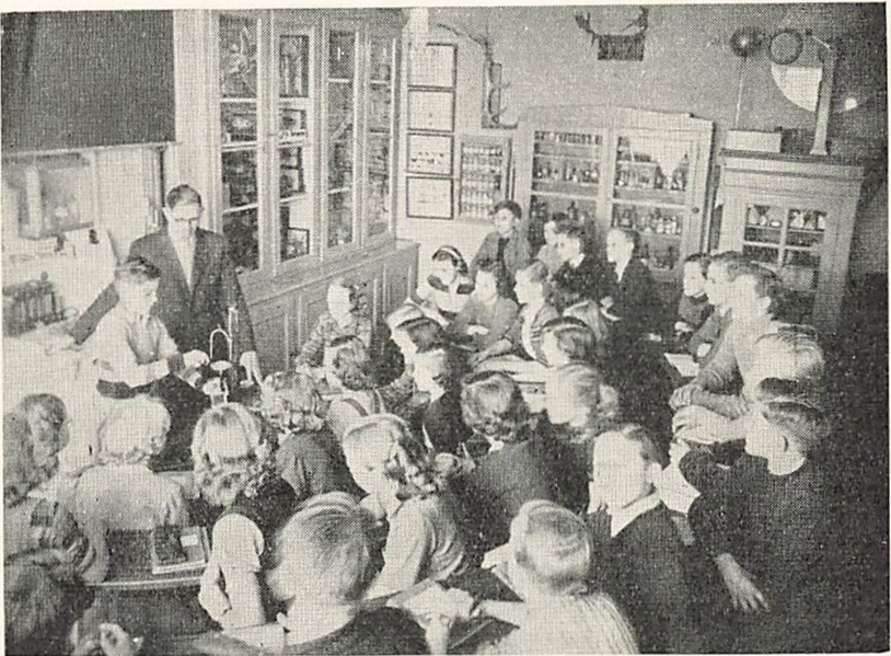
Fra Fysik og Naturhistorielokalet.