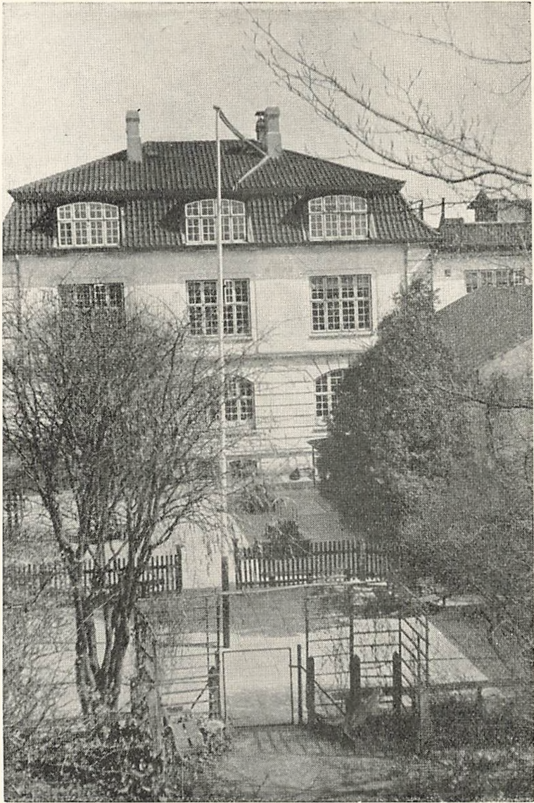
Skolebygningen og de to Legepladser — Underklassernes Legeplads i Forgrunden.