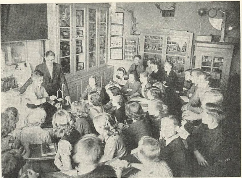
Fra Fysik- og Naturhistorielokalet.