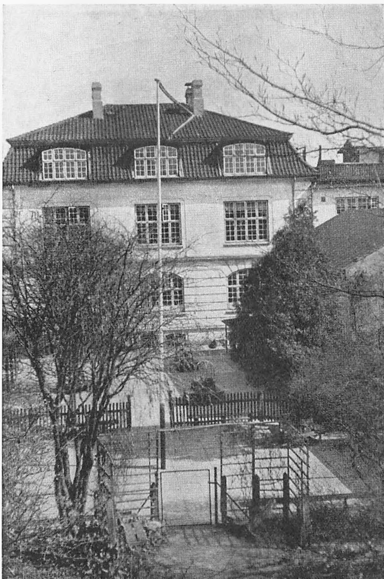
Skolebygningen og de to Legepladser — Underklassernes Legeplads i Forgrunden.