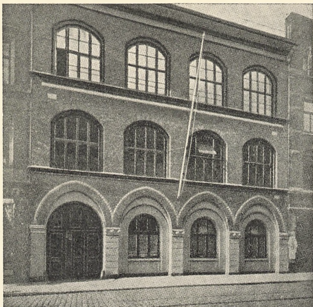
Akademiets nye Lokaler, Guldsmædgade 25.

Fra Begyndelsen af det kommende Kursusaar flytter Akademiets Undervisning til Præliminær- og Studentereksamen ind i Skolebygningen Guldsmædgade 25, hvor tidligere Forældreskolen i Aarhus havde til Huse. Foruden en Række Klasseværelser indrettes i Bygningen et fysisk-kemisk Laboratorium og et Særlokale med Samlinger til Undervisningen i Naturfag.