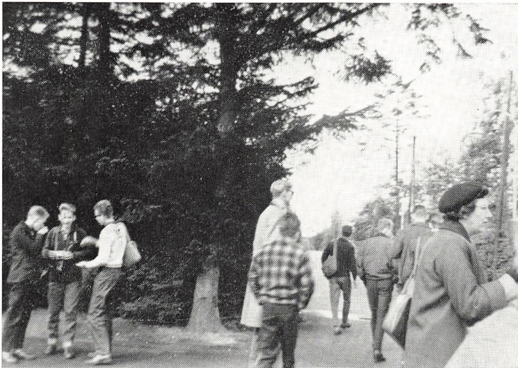
Lejrskolen, Sydslesvig 1961. Egnen langs Slien studeres.