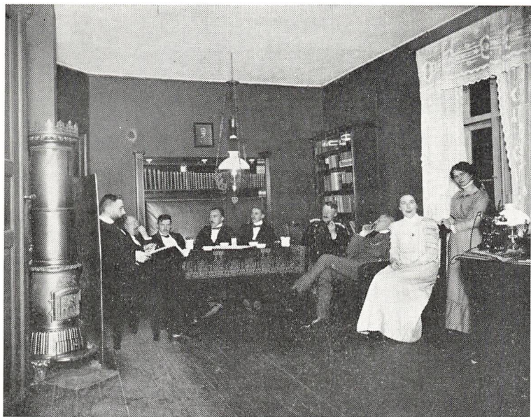
Lærermøde på Fengers skole ca. 1910.