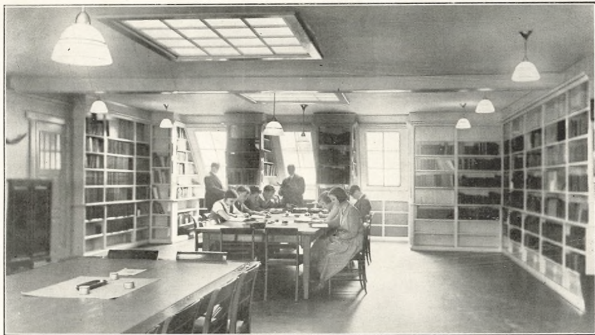
Skolens nyindrettede Læsesal.