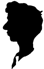
Klaus Nordfeld, forretningsfører. Lay-out