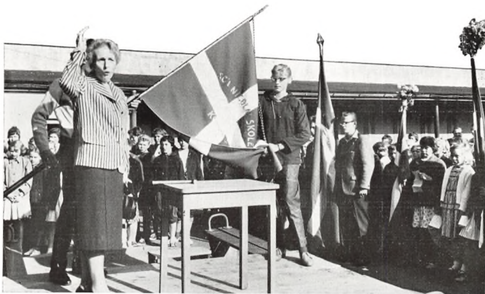
Faneindvielsen på Sct. Nicolaj skole.

Den 13. maj 59 var 3.—5. klasse på udflugt til Odense og 6.—9. klasse samt eksamensklasserne til Nyborg. Ved en lille højtidelighed inden udflugten var der indvielse af en fane, der er skænket skolen af en kreds af forældre.