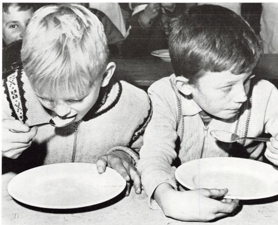
God nærende mad nydes i Skolegades børnebespisning.

Kontorlokalerne Rendebanen 4, er med deres centrale beliggenhed vel-egnede til forældresamtalerne. Også det kontormæssige arbejde foregår her, journalføring, kartotekføring, rapportskrivning, korrespondance m. m.