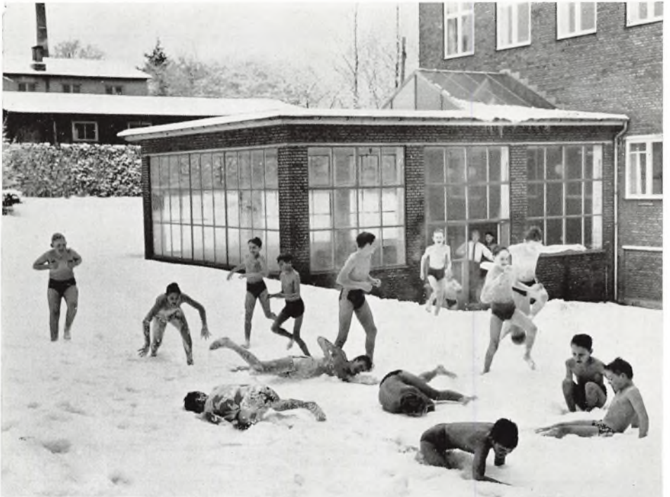
Eleverne ruller sig i sneen efter badstuebadet. Sdr. Vang skole.

En afsluttende fodboldkamp mellem Ålykkeskolen og Kolding gymnasium, blev vundet af sidstnævnte, der samtidig fik første andel i en pokal, udsat af en fodboldinteresseret forældre.