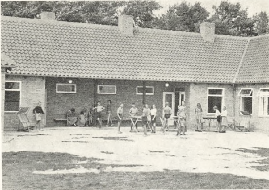
En sommerdag på feriekolonien.