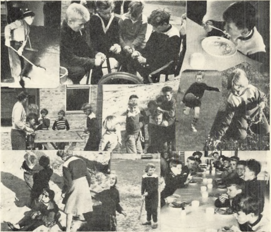
Glimt fra svagbørnskolonien 1956.

Kommunens feriekoloni ved Gedesby skole blev også i dette skoleår benyttet både som lejrskole og som svagbørns- og feriekoloni.