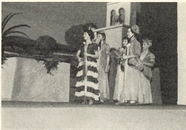
En situation fra en af de årlige skolefester.