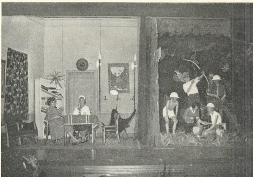
Fra en af de årlige skolefester