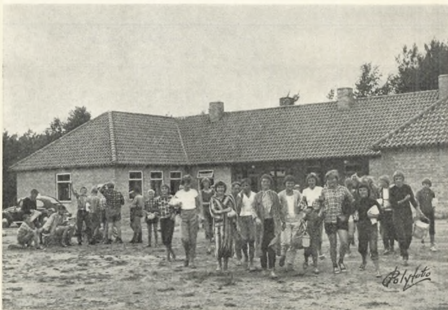
På vej til strandbadet

Kommunens feriekoloni ved Gedesby blev også i dette skoleår benyttet både som lejrskole og som svagbørns- og feriekoloni.