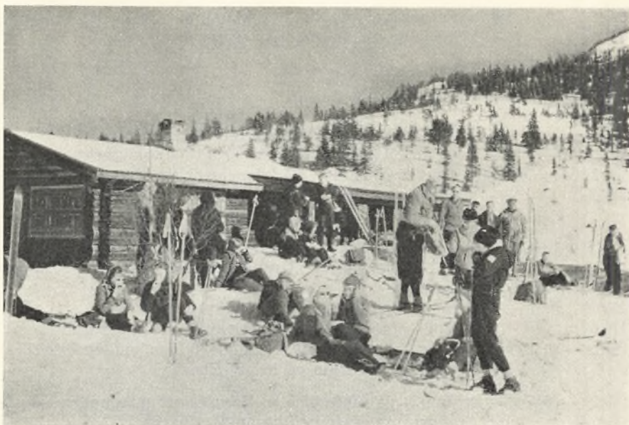
Fra turen til Hjørtedal

Som erstatning for den sparsomme sne fik børnene til gengæld lejlighed til at besøge forskellige fabrikker og seværdigheder i byen og omegnen, ligesom der en af aftenerne var arrangeret en festlig dansk-norsk aften for både gæster og værter.