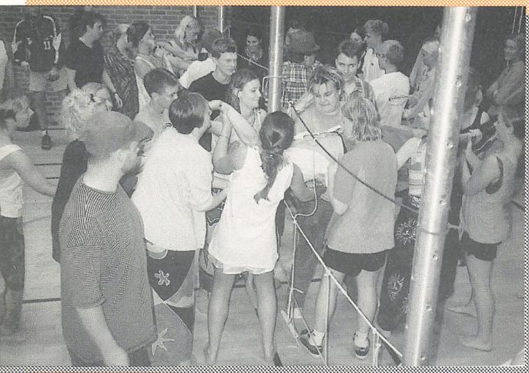
Spindelvæv kræver samarbejde og koncentration