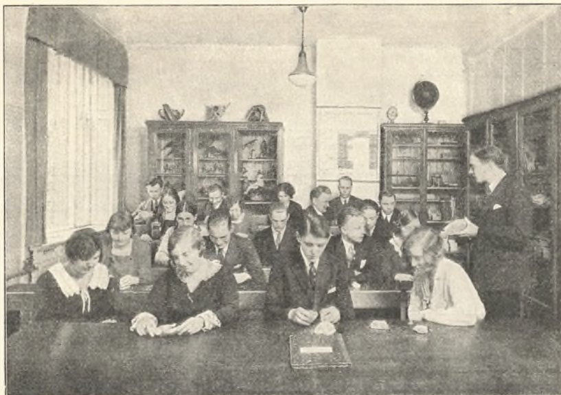
EN NATURFAGSTIME PAA FORMIDDAGSHOLD

videnskabelige Hold under Lærerens Ledelse med Udførelsen af en Række fysiske og kemiske Eksperimenter; ved det selvstændige Arbejde hermed faar Eleverne Lejlighed til paa en for dem interessant Maade at tilegne sig Lærestoffet.