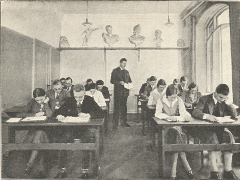
EN LATINTIME PAA FORMIDDAGSHOLD

hed en Optagelsesprøve (om Kravene ved denne, se Side 37).