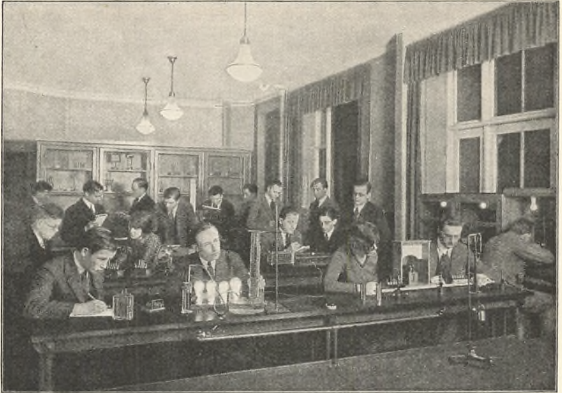
EN FYSIKTIME PAA AFTENHOLD