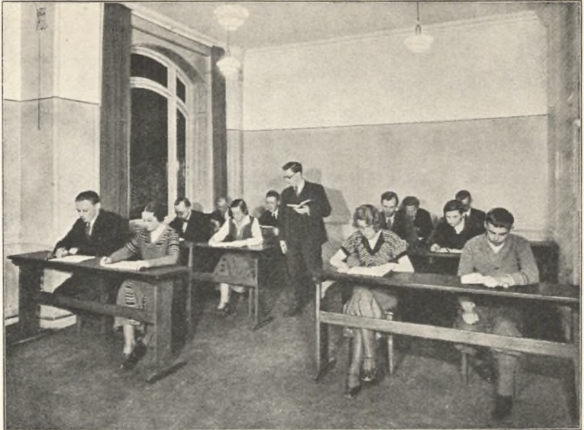
EN TYSKTID PAA AFTENHOLD