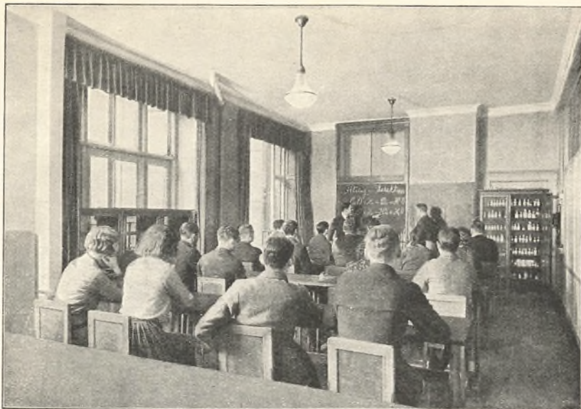
EN KEMITIME PAA FORMIDDAGSHOLD

af dette i alle Fag en systematisk Gennemgang og Repetition under nøje Hensyntagen til Kravene ved Eksamen. Formiddagsholdene er særlig beregnet for de ganske unge Elever, og Undervisningen er anlagt i Lighed med Gymnasieskolernes, medens der ved Tilrettelæggelsen af Undervisningen paa Aftenholdene er taget Hensyn baade til Deltagernes større Modenhed og til den kortere Tid, der maa formodes at staa til deres Raadighed ved Forberedelsen af det daglige Stof.