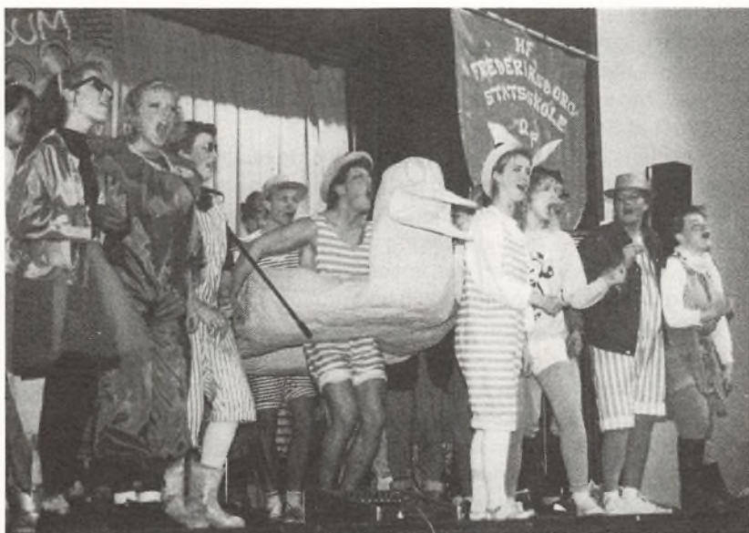
Fra 2. hf's sidste skoledag