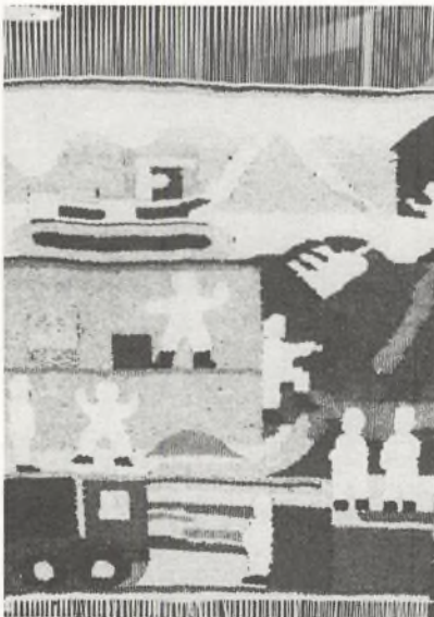
Vægtæppe med motiv fra byggeriet. Vævet som fællesarbejde i formningstimerne.