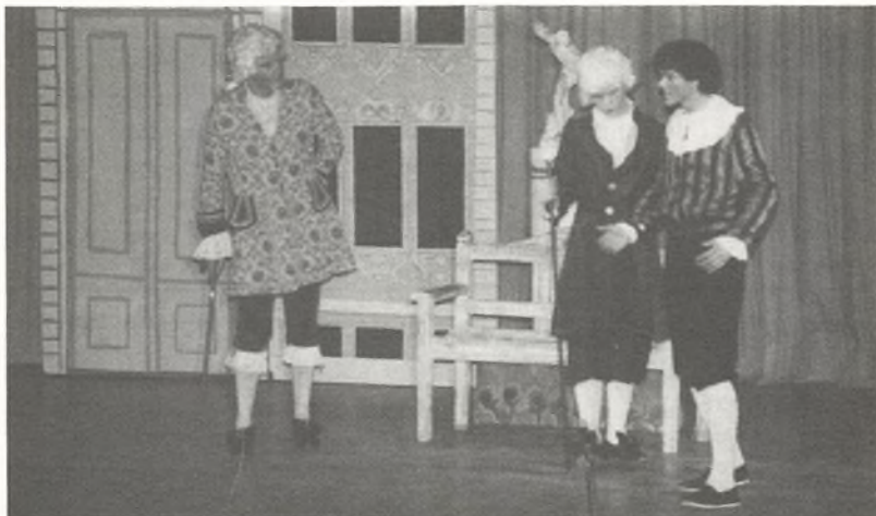
Fra årets skolekomedie »Maskerade«