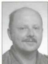
Allan Nissen (AP)

Østermarken 14, Kølkær 7400 Herning Tlf. 97 14 71 57