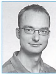
Bo Møller Musik/ samfundsfag