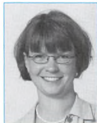
Line Sterum Greibe Samfundsfag/ dansk