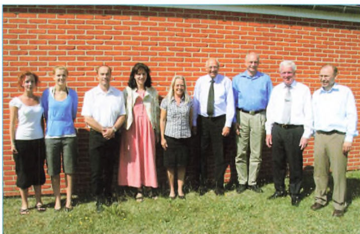
Billedet er taget ved bestyrelsesmødet den 7. juni 2007

Bestyrelsen er ansvarlig overfor Undervisningsministeriet for institutionens overordnede drift. Bestyrelsen afholder 4-5 møder om året. Beslutningsreferat fra møderne vil blive lagt på skolens hjemmeside.