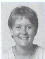
Trille Hertz Kemi/matematik/ naturfag