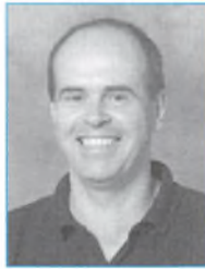
Bert Rainer Ernst Historie/tysk/ drama