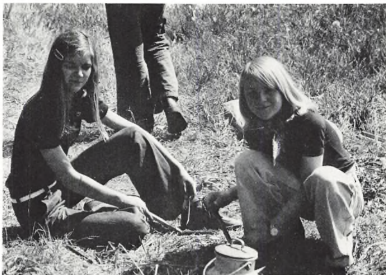
Mad på bål.