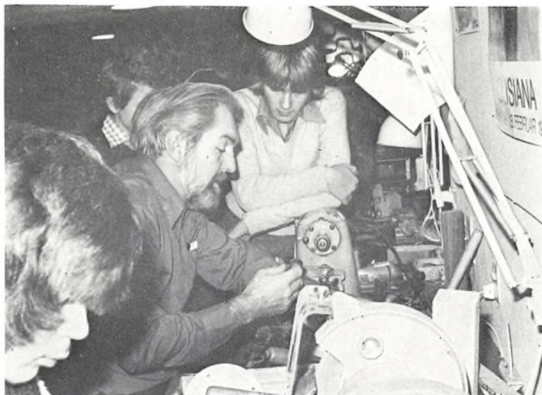
Travlhed i sløjsalen.

For 8. gang holdt vi „Novemberuge“ på skolen. Fra 6. klasse og op efter lagde eleverne deres eget skema for en uge ud fra det program, der blev udsendt med 48 forskellige mulige aktiviteter. Meget forskellige, ja: pibemageri, moderne matematik for forældre og elever, regnestokkemethoden, zoneterapi, besøg på Danmarks tekniske højskole, blodtypebestemmelse, dyrepsykologi, hestepasning for begyndere, lystfiskerkursus, skoven, astronomi, afspænding, lanciers for forældre og lærere, besøg på Christianshavn, indisk madlavning, kommunalt kursus, maskinskrivning, hypnose, udstopning af fugle, tysk grammatik, tur til skøjtehal og svømmehal eller til København, besøg på en moderne industrivirksomhed, introduktion i golfspil, kursus i babysitting, foto, latin, skak, bagning af „det daglige brød“, trampolinspring, bridge, tur til Louisiana, sy en primitiv skjorte, persisk madlavning, turnering i basket-ball, bordtennis, volley-ball, badminton.