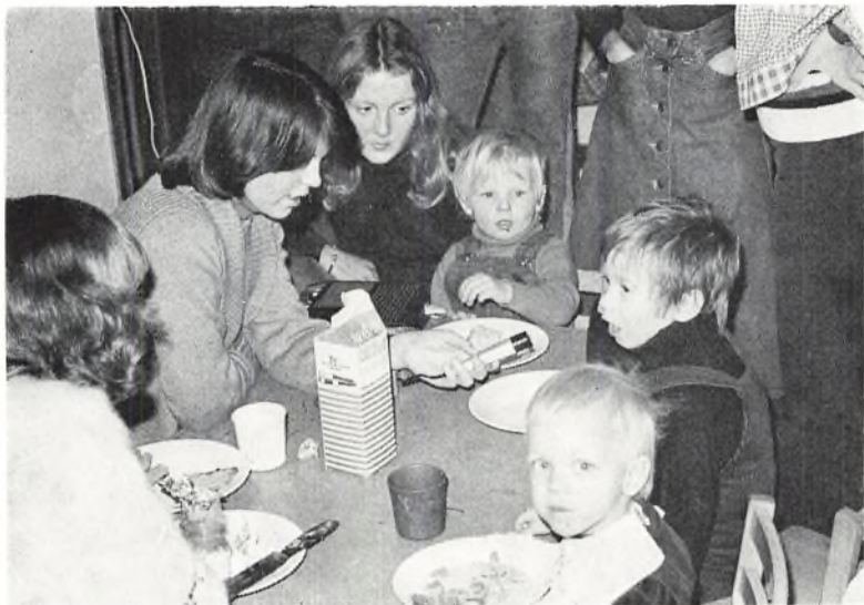
Besøg i børnehave.

Også de mindre klasser var ude af deres normale skema, men i lidt fastere rammer. Det var dejligt at så mange af skolens store elever hjalp til med at gøre ugen god for de mindre.