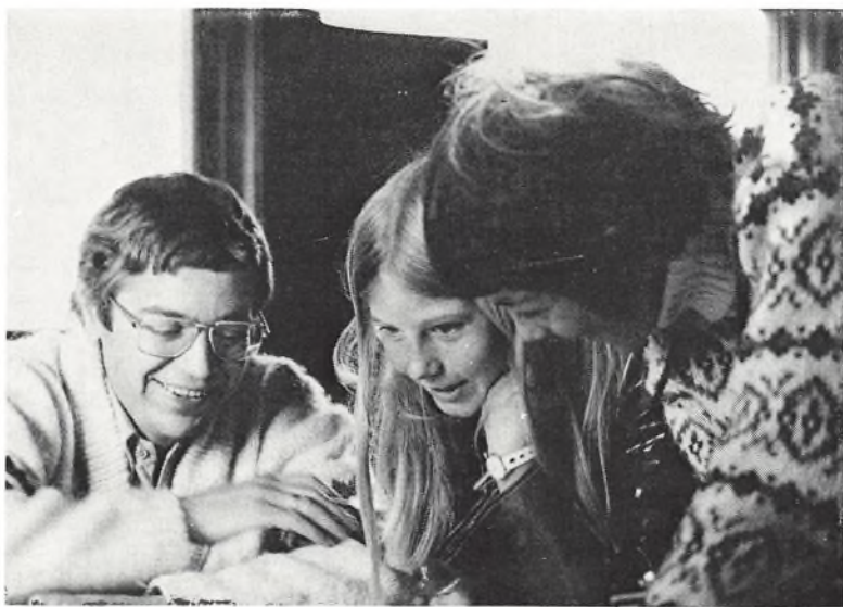
Man hygger sig.