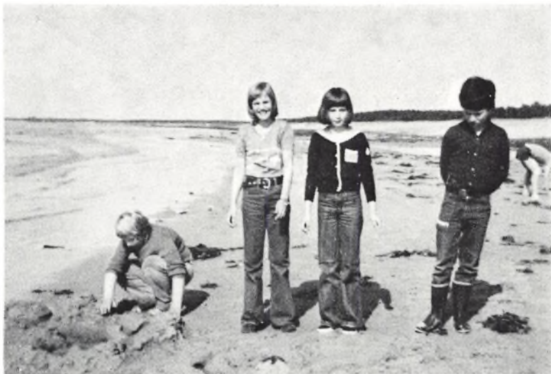
På Høve strand.

Eftermiddagen indledtes med, at vi orienterede os på lejrskolens 15 tdr. land store naturgrund, der grænsede op til en stor nåletræs-plantage. Der var adskillige fod- og håndboldbaner, og grunden gik lige over i den brede strand, hvor Sejerøbugten lå foran os. Om eftermiddagen skulle klassen, inddelt i fem grupper, bygge sand-borge, og der kom mange fantasifulde og geniale bygningsværker ud af det.