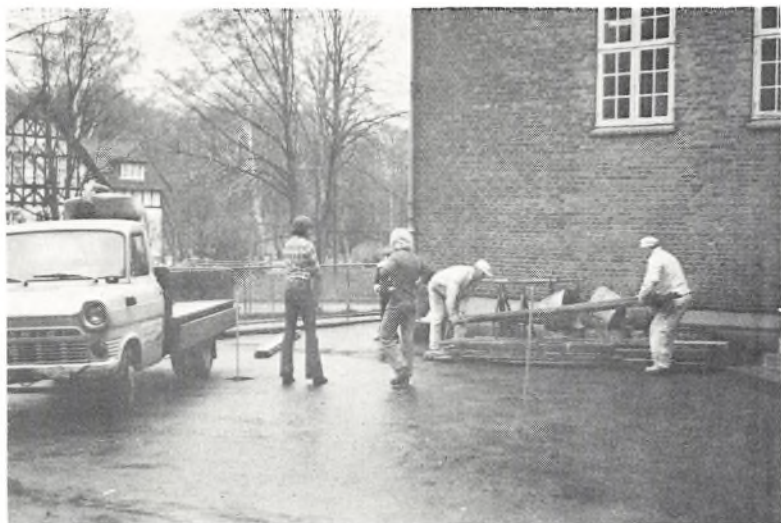
Sådan begyndte det.