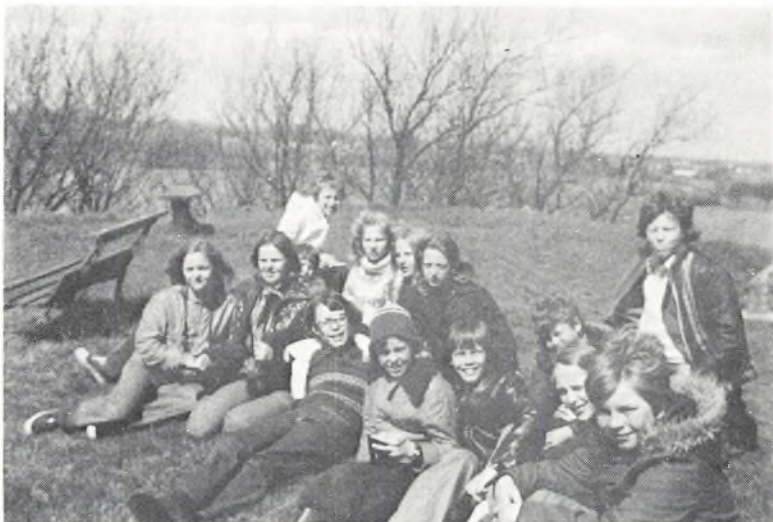
Forårssol på Samsø.

Igennem årene har vi været på lejrskole på Sandbjerg, på Lolland, på Bornholm, så denne gang måtte vi længere nordpå. Valget faldt på Samsø, som få eller ingen af os kendte. Vi fandt frem til Sælvig-bugtens Camping, hvor vi kunne blive indkvarteret i små hytter. Det gav helt nye muligheder, idet vi kunne deles op i familier, der hver for sig lavede maden.