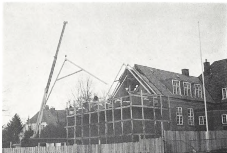
Spærrene løftes på plads.