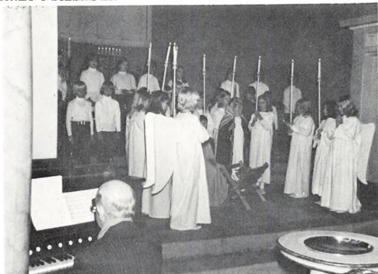
Julespil i Hørsholm kirke.