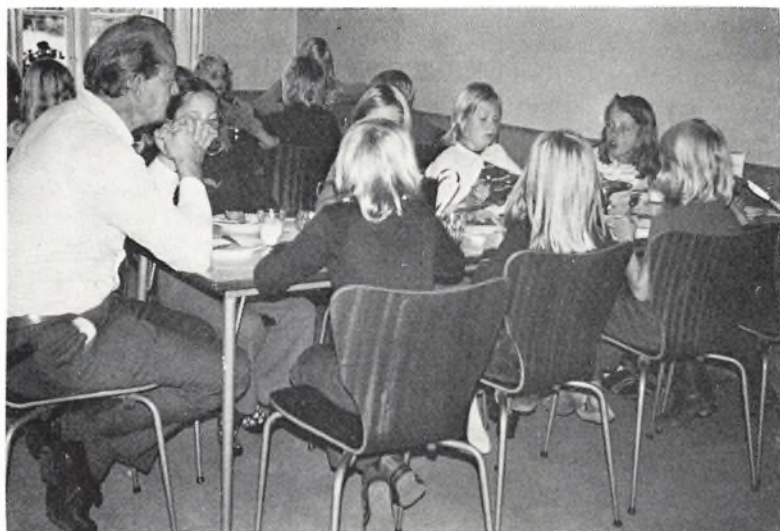
Ingen albuer på bordet, børn!