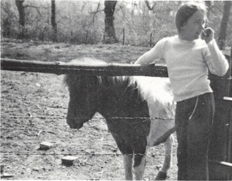
Ah!! En pony!

Efter nogle overvejelser besluttede vi os til at rejse til lejrskolen „Høve Strand“ i Odsherred. I denne nordvestlige del af Sjælland mellem Kattegat, Isefjord og Sejrø bugt var vi klare over, at eleverne kunne opleve næsten alle former for dansk natur.