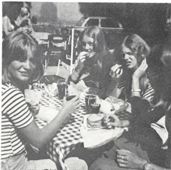
Danske turister spiser.