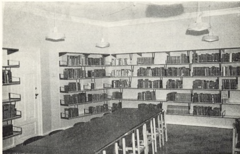
Et hjørne af det bibliotekslokale, skolen har fået indrettet på 1. sal i ejendommen Bondetinget 1. Foruden det er der blevet plads til et udlånslokale, et klasselokale, et kontor for bibliotekaren samt et elevrådsværelse og et bogmagasin.

Det vil give mange problemer at slås med, og fuldt tilfredsstillende vil de ikke kunne løses.